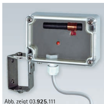
Abb. zeigt 03.925.111

Das DCF77-Zeitzeichentelegramm, gesendet auf der Frequenz 77,5 kHz vom deutschen Zeitzeichensender Mainflingen bei Frankfurt, ist ein übergeordnetes Zeitnormal zur Synchronisation sowie zur automatischen Sommer-/Winterzeitumstellung von Funkuhren und Zeitdienstanlagen. Dieser PEWETA DCF77-Funkempfänger liefert die Zeit- und Datuminformationen an alle PEWETA-Hauptuhren.