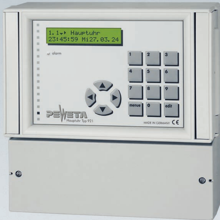
Abb. zeigt 10.921.122