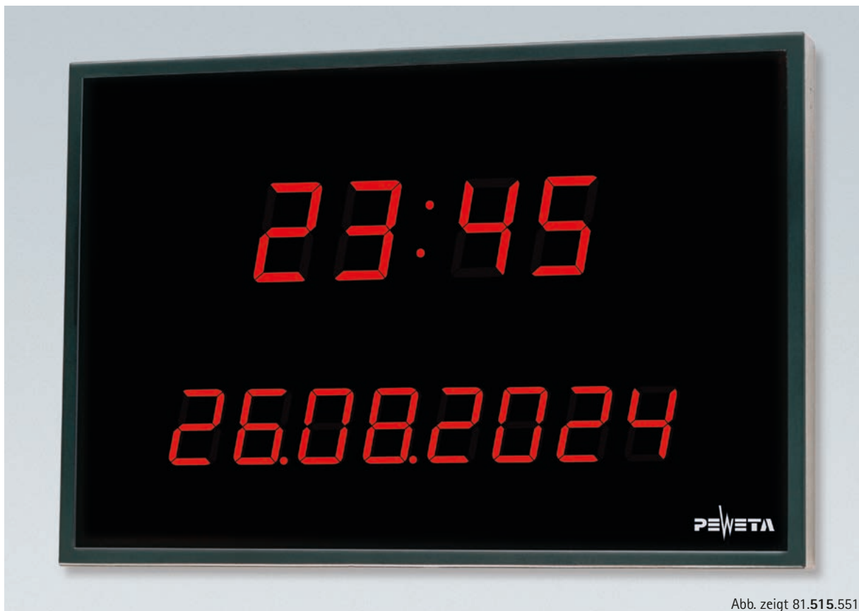
Abb. zeigt 81.515.551

LED-Digitaluhren mit deutlichen, hell leuchtenden Balken-LEDs, wahlweise mit ein- oder doppelseitiger Anzeige, garantieren immer eine optimale Ablesbarkeit.