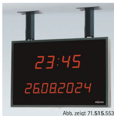
Abb. zeigt 71.515.553

LED-Digitaluhren mit deutlichen, hell leuchtenden Balken-LEDs, wahlweise mit ein- oder doppelseitiger Anzeige, garantieren immer eine optimale Ablesbarkeit.