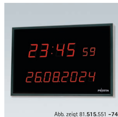
Abb. zeigt 81.515.551 -74