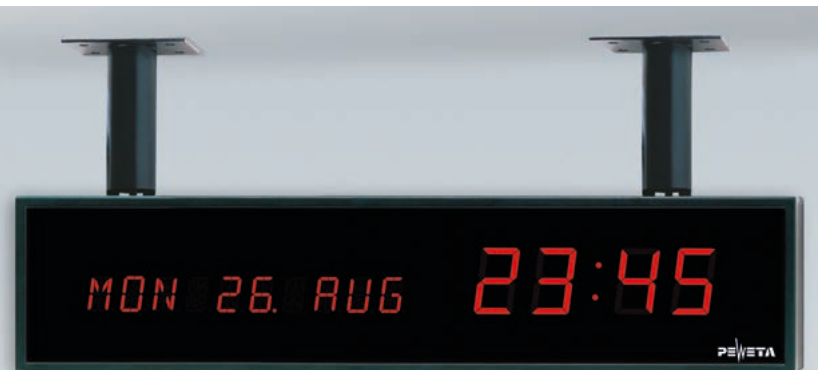
Abb. zeigt 91.512.553

Unterschiedliche Datumsformate im Menü einstellbar