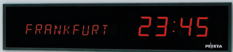
Abb. zeigt 91.512.551 -75

Unterschiedliche Datumsformate im Menü einstellbar