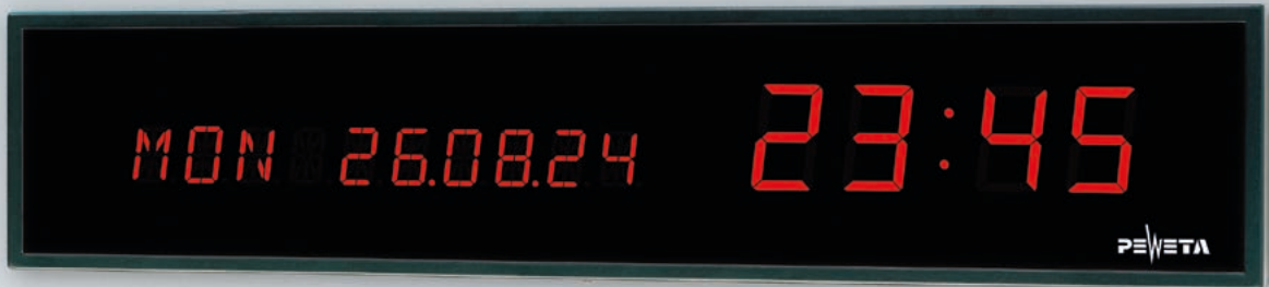
Abb. zeigt 91.512.551

Doppelseitige LED-Digitaluhren werden anschlussfertig verdrahtet und bereits komplett montiert geliefert.