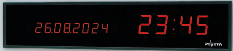
Abb. zeigt 91.512.551