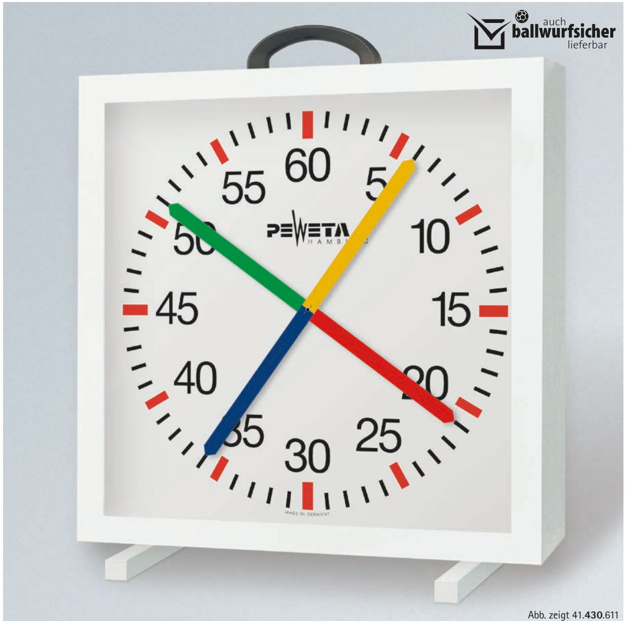
Abb. zeigt 41.430.611

Diese Trainingsuhr ermöglicht die Anzeige von Zwischenzeiten im Schwimmtraining und beim Einschwimmen. Die Zeiten nimmt jeder Schwimmer selbst. Das 4-farbige Zeigerkreuz zeigt die abgelaufene Zeit, eine Umdrehung entspricht 60 Sekunden.