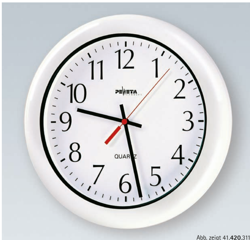
Abb. zeigt 41.420.311

schwarze Balkenzeiger für Stunden- und Minutenanzeige, roter Sekunden- zeiger.