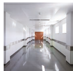
Innenuhren analog doppelseitig