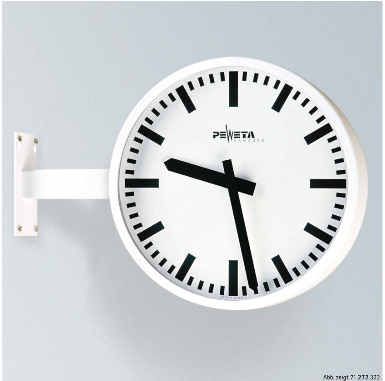
Abb. zeigt 71.272.322

Doppelseitige Uhren – überall dort, wo die Uhrzeit beidseitig ablesbar sein soll. Metall, robust, passt!