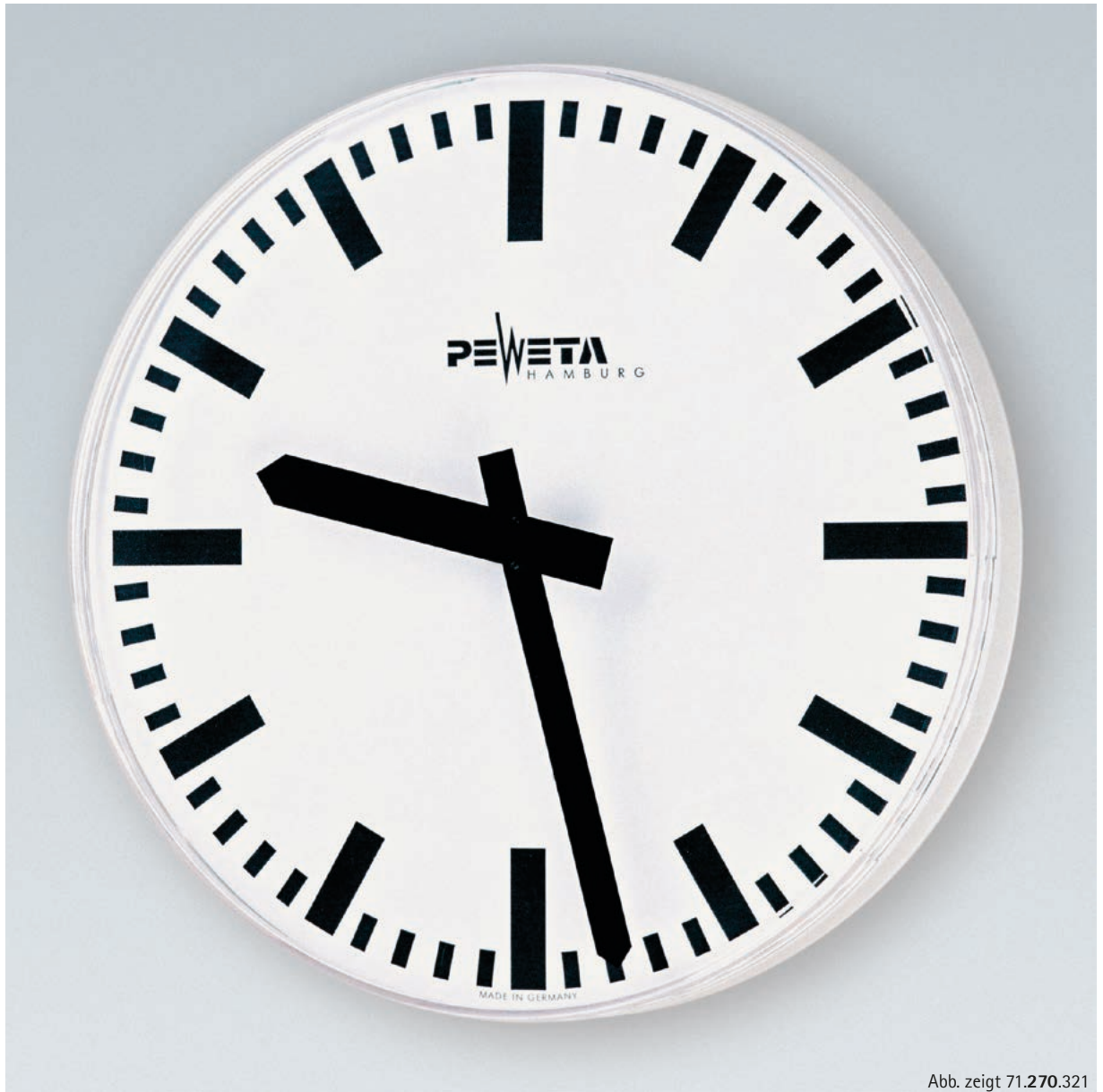
Abb. zeigt 71.270.321

Wanduhren mit stoßgeschütztem Kunststoffgehäuse. Zeitgemäß, aktuell, funktionell. Darauf ist Verlass!