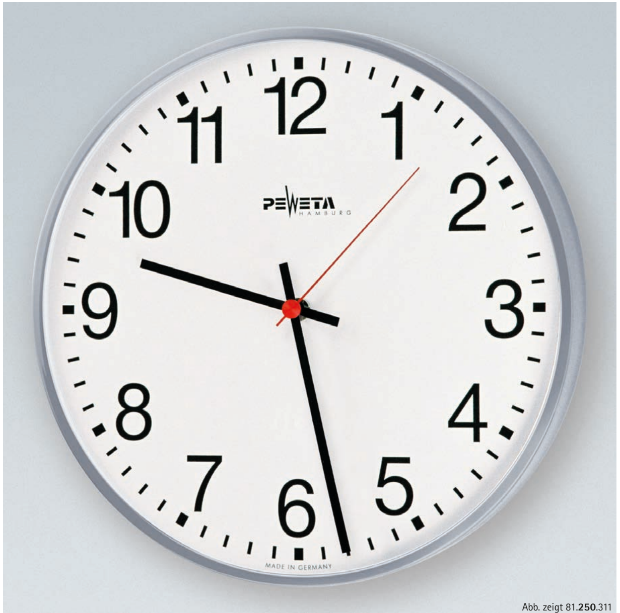
Abb. zeigt 81.250.311

Repräsentative Wanduhren für anspruchsvolle Umgebungen – die professionellste Art, die Uhrzeit anzuzeigen.