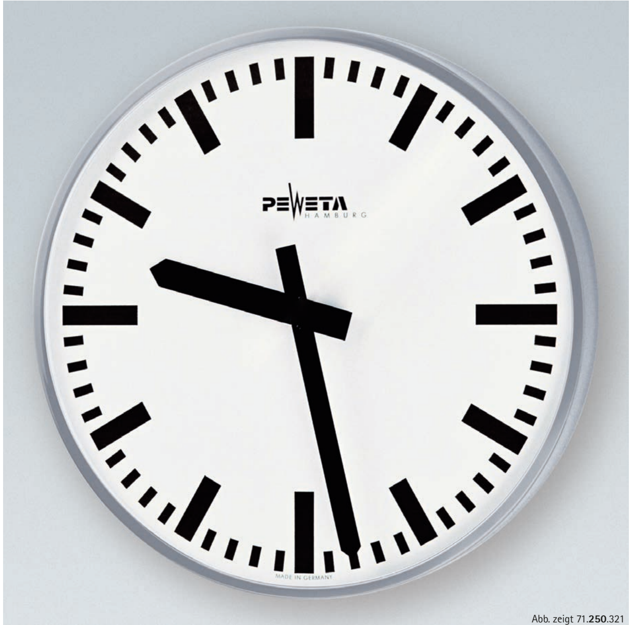
Abb. zeigt 71.250.321

Repräsentative Wanduhren für anspruchsvolle Umgebungen – die professionellste Art, die Uhrzeit anzuzeigen.