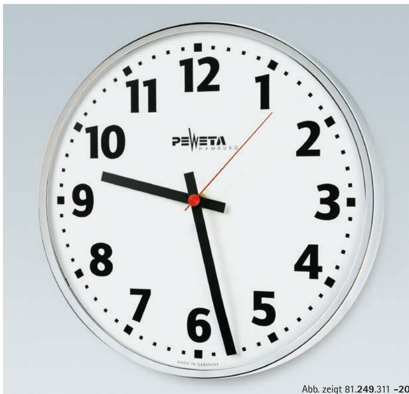
Abb. zeigt 81.249.311 -20