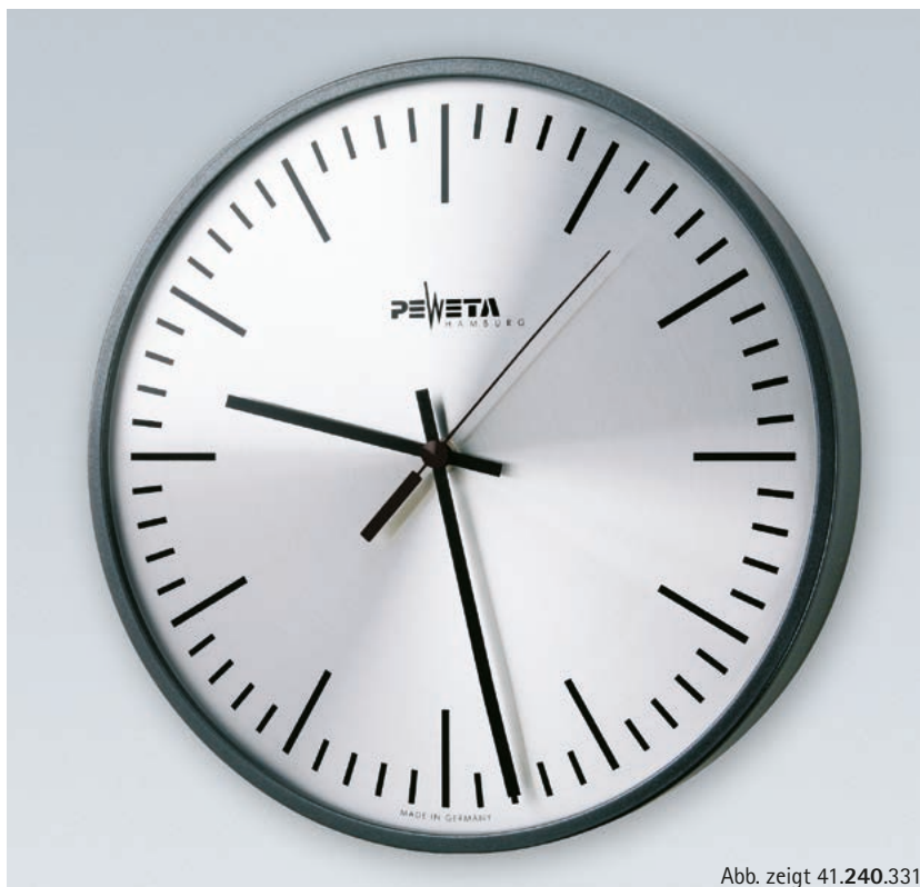
Abb. zeigt 41.240.331