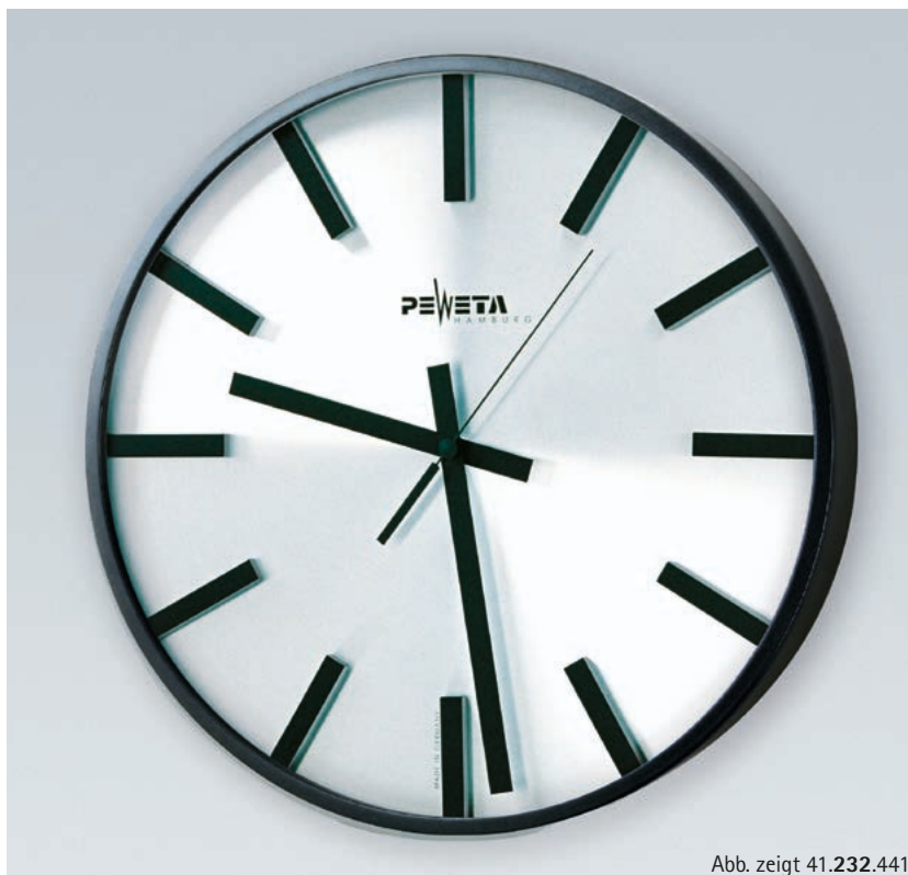
Abb. zeigt 41.232.441

Funkuhren DCF77 und Nebenuhren AirPort24 mit Netzbetrieb 230 V dieser Typreihe werden mit integrierter Gangreserve geliefert, Weiterbetrieb bei Stromausfall ca. 14 Tage.