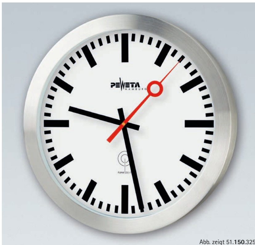
Abb. zeigt 51.150.325

schwarze Balkenzeiger für Stunden- und Minutenanzeige, typischer roter Bahnhof-Sekundenzeiger mit „Auge“.