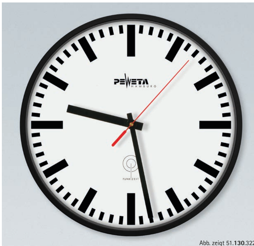
Abb. zeigt 51.130.322

schwarze Balkenzeiger für Stunden- und Minutenanzeige, roter Sekunden- zeiger.